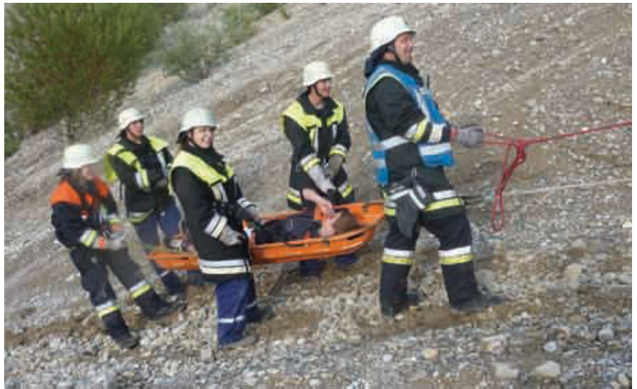
Auf dem Bild ist zusehen wie man einen Verletzten mit der Absturzsicherungsausrüstung einen Hang nach oben bringt.