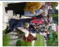
▶ Nachbarschaftstage Praxis am Nachmittag

Thematisiert werden vor allem Fragen zur Gewässerunterhaltung. Dabei werden die an den Nachbarschaftstagen geäußerten Themenwünsche aufgegriffen.