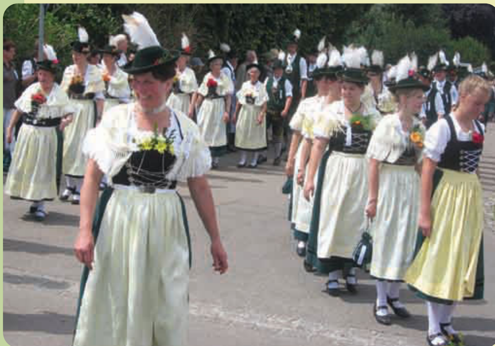
Festzug 100 Jahre Trachtenverein „Lechroaner“ Epfach