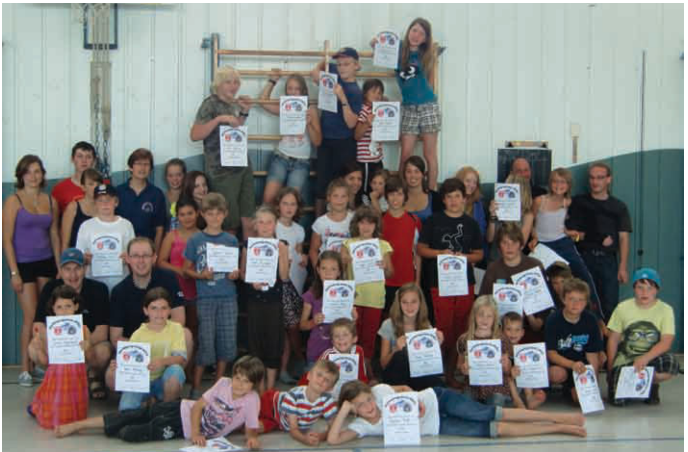
Gruppenbild vom Ferienprogramm der Schützen/Feuerwehr/Musikverein am 19. + .20. August 2011

Zu diesem Thema bieten wir einen Vortrag am Montag, 10. Oktober im Gasthaus Hirsch an und laden alle Mitglieder und Interessierte dazu herzlich ein.