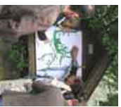
▶ Ein Gewässerrechtlich vorgefertigtes VWA

Wissenstransfer und Erfahrungsaustausch leben von kompetenten Fachleuten.