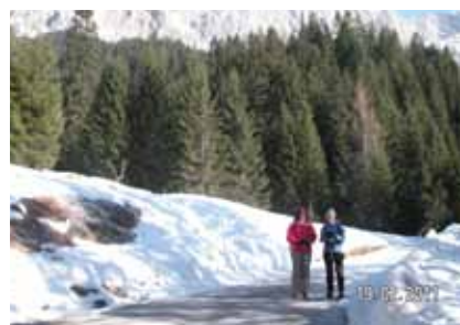
Ein Teil der Wander-Truppe

Langläufer, Skifahrer, Snowboarder und Winterwanderer anzusprechen und zu gemeinsamer Aktivität aufzurufen, ging auf. „Drei