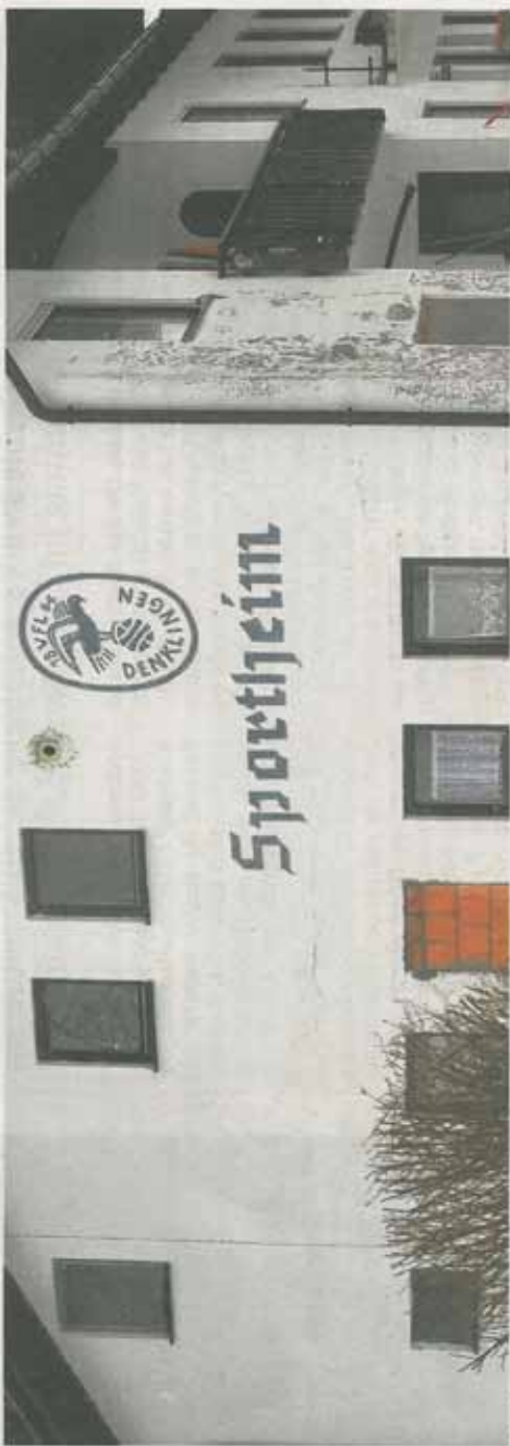
Marode und abrispswürdig: das alte VfL-Sportheim am Denklinger Forchet.

Wie berichtet, besteht wegen des maroden und nicht mehr sonie-rungswürdigen alten VfL-Sportheims am Ortsrand von Denklingen seit ein paar Jahren der Wunsch nach einem Neubau. Allerdings hatte der Gemeinderat im Dezember 2009 neue Zuschussrichtlinien für Vereine beschlossen, die – im Sinne der Gleichbehandlung aller Vereine – eine maximale Zuschusshöhe von 20 Prozent vorsahen ( LT berichtete ). Eine Unterstützung, die dem/ den Verein(en) nicht für die Neubaurealisierung gereicht hätte, wie die Vorsitzenden mehrmals kundtaten. Um die Diskussionen in geordnete Bahnen zu lenken, gründete sich im Juli 2010 ein Arbeitskreis (AK) aus Vereinsvertretern, Architekt, Räten und der Bürgermeisterin, der mehrmals tagte und das Thema Vereinsheim diskutierte – laut Bürgermeisterin Viktoria Horber mitunter sehr hitzig. Zur Debat-