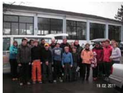
Die Wintersport-Truppe der Sparte Berg/Wandern des VfL Denklingen