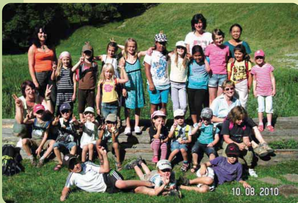
Ausflug in den Wildpark Landsberg im Rahmen des Ferienprogramms der Vereine