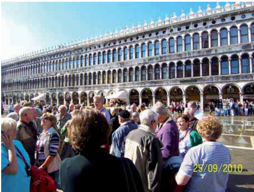
Die 50köpfige Ausflugsgruppe des Veteranenvereins Epfach in Venedig

Herbstliche, aber angenehme Temperaturen am Freitag, fast sommerliche 22 Grad am Samstag in Venedig und eine Schneeballschlacht auf dem Lagazuoi (2852m) – so kann der Ausflug des Veteranenvereins Epfach vom 24. Bis 26. September 2010 beschrieben werden. 50 Frauen und Männer durften am Freitag eine Stadtführung in Bruneck, der Stadt des Bischofs Bruno erleben. Neben der Historie war die Architektur des neuen Rathauses von Bruneck beeindruckend. Begleitet von einer Reiseführerin besuchten wir die Kriegsgräberstätte Nasswand. Auf diesem Friedhof fanden Gefallene, die fast ausschließlich aus den damaligen Balkanstaaten stammenden Soldaten ihre letzte Ruhe. Anschließend begab sich die Gruppe auf die 2320m gelegene Auronzohütte, die unmittelbar unterhalb der „Drei Zinnen“ liegt. Auch hier wurden den Teilnehmern die Geschehnisse des I. Weltkriegs erläutert. Ziel des 1. Tages war Cortina d'Ampezzo. Vor dem Abendessen im Hotel nutzten noch einige die Gelegenheit etwas von der Stadt zu sehen.