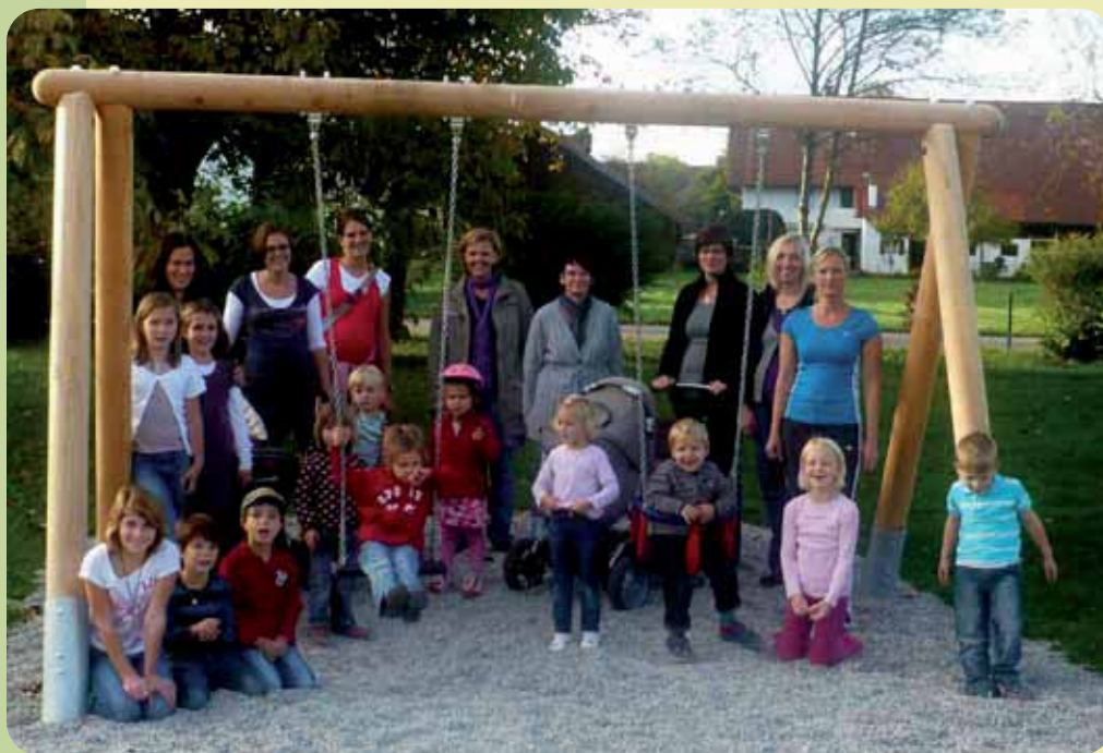
Klamottenkiste Team spendet Kleinkindschaukel für Kinderspielplatz